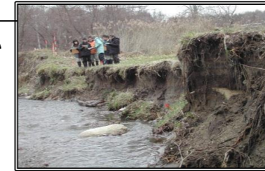
◆災害の立会い(道南方面)

また、地震や台風などで道路等公共的な施設が被害を受けたときには、現地にて災害の状況や国が負担する復旧事業費の金額を確認するなどして、少しでも早く災害復旧が行われ、生活環境の安定が図られるよう努めています。