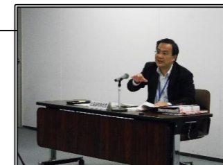
◆管内経済情勢報告(28年7月)

企業 へのヒアリングや地域経済に関するデータを収集・分析して、地域の経済情勢をタイムリーに把握し、四半期毎に財務大臣や財務省の幹部に報告しています。財務省では、報告された各地域の経済情勢を踏まえ、各種マクロ経済政策を企画・立案していくこととなります。