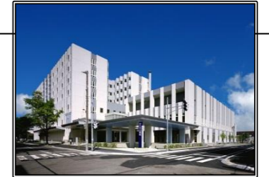
◆砂川市立病院への資金貸付

また、資金の貸し手としての立場から、貸付先である地方公共団体の財政状況を把握するためのヒアリングを行っています。