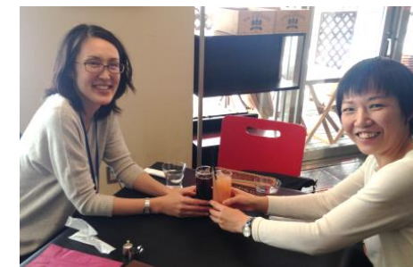
昼食時は職場の先輩に仕事も子育てもまとめて相談しています

そして時は流れ、今、私はまさに『仕事と子育ての両立』真っ只中です。子供が1歳半になった平成26年4月に職場復帰をしましたが、その間、産前・産後休暇に加え、育児休業を取得しています。育児休業は最大3年間の取得が可能となっており、どのタイミングで職場復帰するのか、自分で選択することができました。また、復帰後3か月間は勤務時間短縮制度を活用し、1時間早く退庁、子供が保育園や新生活にゆっくり順応するための時間にしました。この制度活用についても、事前に人事担当者へ相談し、自分で取得時期を決めました。